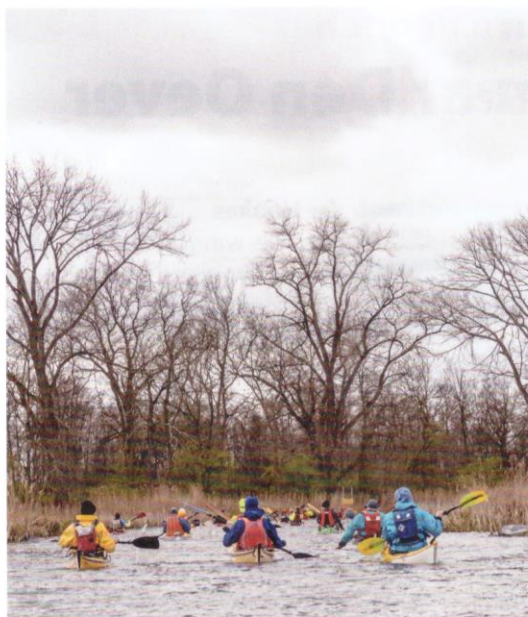
Links: Door de Karnemelksloot. Rechts: Fort Ossenmarkt.