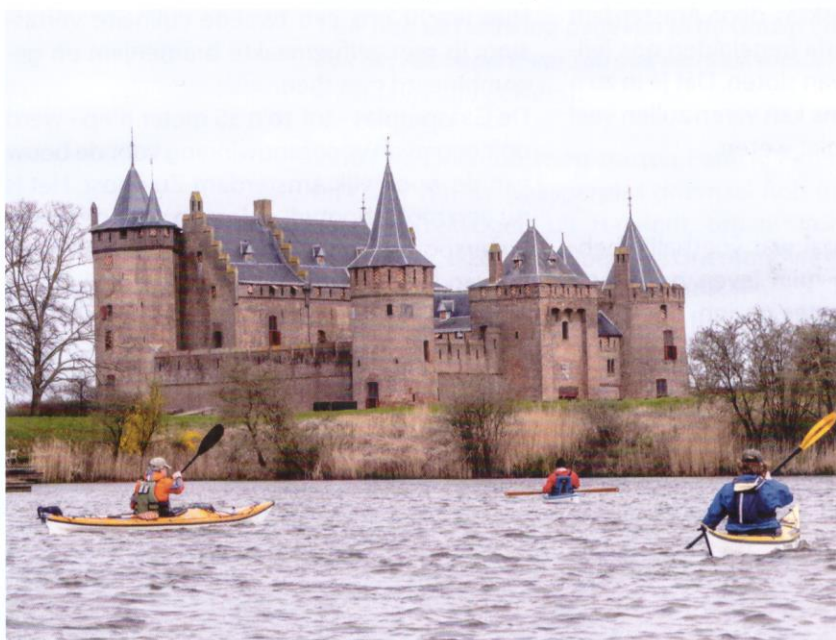
Langs het Muiderslot.

Floris werd er schatrijk van, maar was niet echt populair bij de edelen. We weten hoe het afliep... Toen was je je leven niet zeker, gelukkig hebben wij niets te vrezen op deze stoere route.